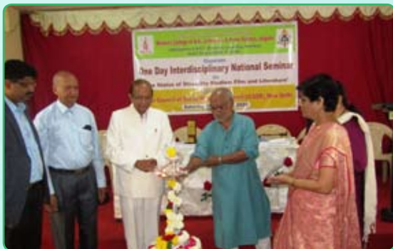
Inauguration of the seminar by the dignitaries.