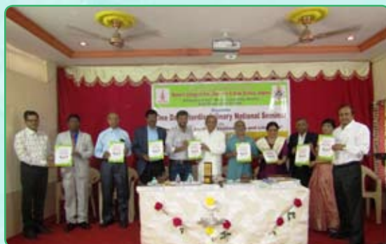
Publication of the Seminar Journal.