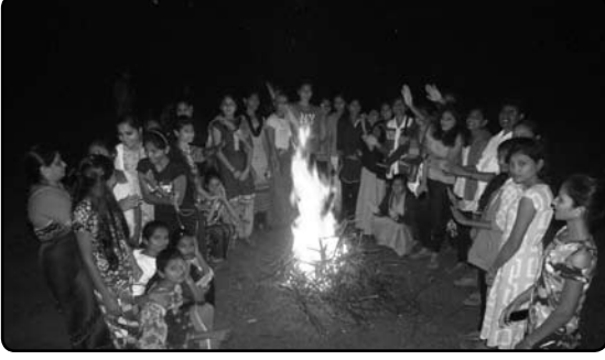
विशेष हिवाळी शिविरात शेकोटीचा आनंद लुटतांना एन.एस.एस. स्वयंसेवक विद्यार्थिनी.