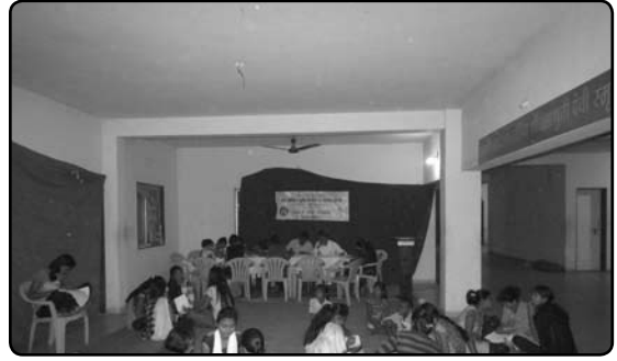
विशेष हिवाळी शिविरात 'माझे सात दिवशीय शिबीर' हा प्रोजेक्ट पूर्ण करण्यात मग्न झालेल्या विद्यार्थिनी व कार्यक्रम अधिकारी.