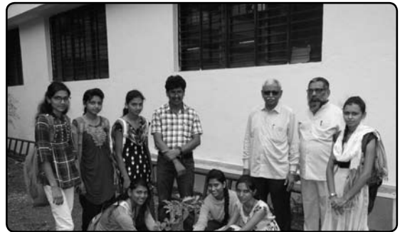
सामाजिक वनमहोत्सव दिनानिमित्त वृक्षरोपण करतांना विद्यार्थिनी व प्राध्यापक.