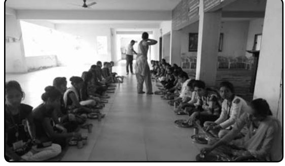
राष्ट्रीय सेवा योजनेच्या कानळदा येथील विशेष शिविरात स्वयंसेवक विद्यार्थिनी स्नेह भोजनाचा आस्वाद घेतांना.