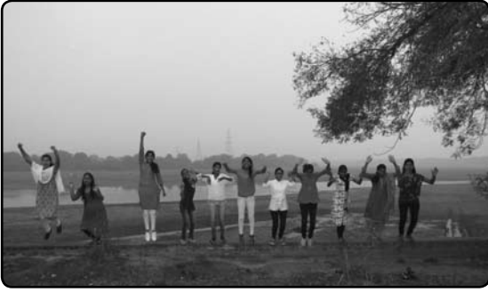
विशेष हिवाळी शिविरात कण्वश्रमाच्या निसर्गरम्य परिसरामध्ये मुक्तपणे जल्लोष करतांना विद्यार्थिनी.